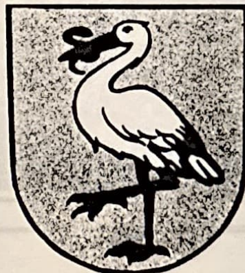
Het wapen van Den Haag.