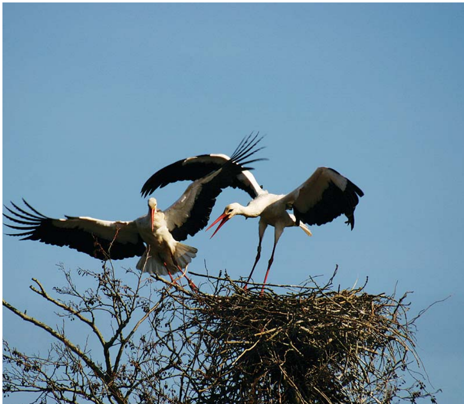
it eibertshiem, earnewâld 4