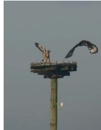
Buizerds als Winterooievaars.

Beste ooievaarsvrienden, Dear Stork friends, La Cigüena, Earrebarrefreonen, Chers amis, chères amies des cigognes, Liebe Storchenfreunde,